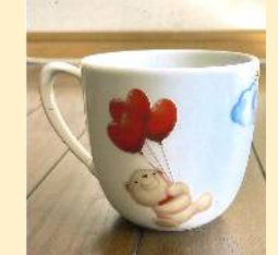
ポーセリンアート