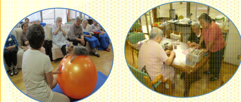
利用者さんとの関わり 洗い物等のお手伝い