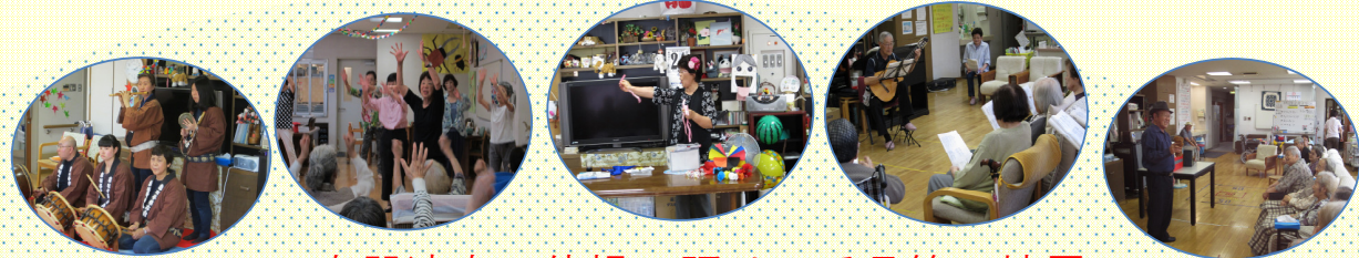
楽器演奏・体操・踊り・手品等の披露