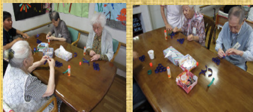
紙テープを輪にして...